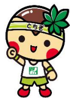
とちまるくん