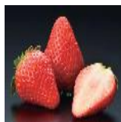
とちぎのいちご様